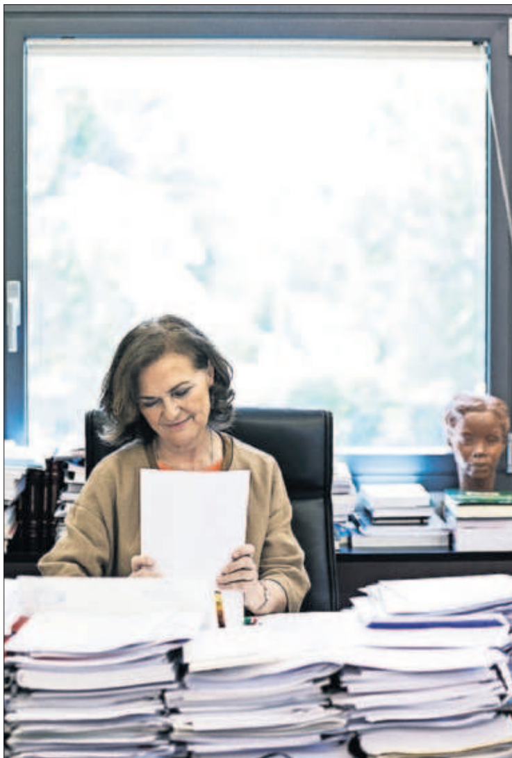
Carmen Calvo, el viernes, en su despacho.

La dirigente socialista critica a Casado “porque no plantea ninguna alternativa”. Y precisa que otros líderes populares con responsabilidad, como Núñez Feijóo, “mantienen una actitud más razonable”. Pero insiste en que el Gobierno busca huir del enfrentamiento con la oposición porque quiere centrarse en lo que, a su juicio, es lo importante: “Tenemos todas nuestras energías volcadas en la desescalada. Sabemos el deterioro social que está causando. En el desconfinamiento es donde se pueden cometer errores muy traumáticos”. PÁGINAS 14 Y 15