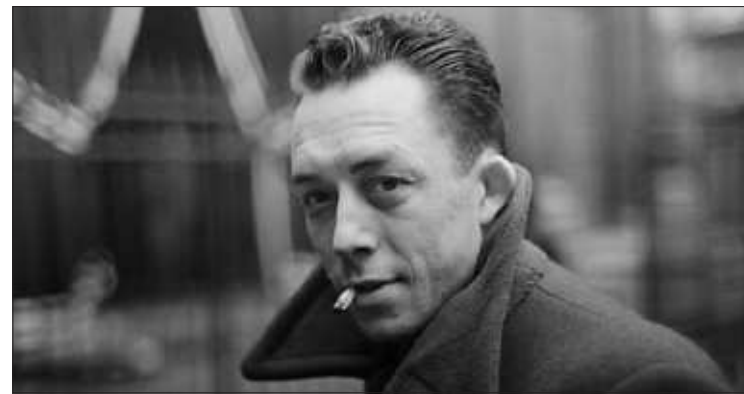
El escritor Albert Camus, en una imagen de Cartier-Bresson en 1944.