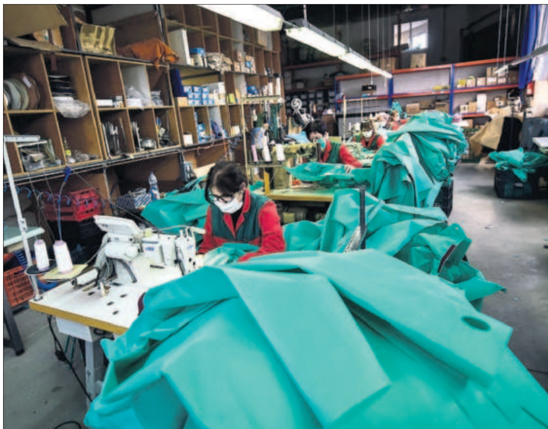
COSTURERAS SOLIDARIAS EN AUXILIO DE LA SANIDAD. Grupos de voluntarios se han movilizado, de acuerdo con empresas locales, para confeccionar ropa y material que necesitan los profesionales sanitarios, como hace este grupo de mujeres en Arnedo (La Rioja). PÁGINA 24

y del PP, cuyo líder, Pablo Casado, avanzó un voto negativo si no hay cambios. El Gobierno, al que se reprocha actuar sin diálogo, prepara nuevas medidas, entre ellas microcréditos para los inquilinos y moratorias en las cotizaciones sociales de autónomos y pymes. PÁGINAS 12 A 14, 37 Y 38