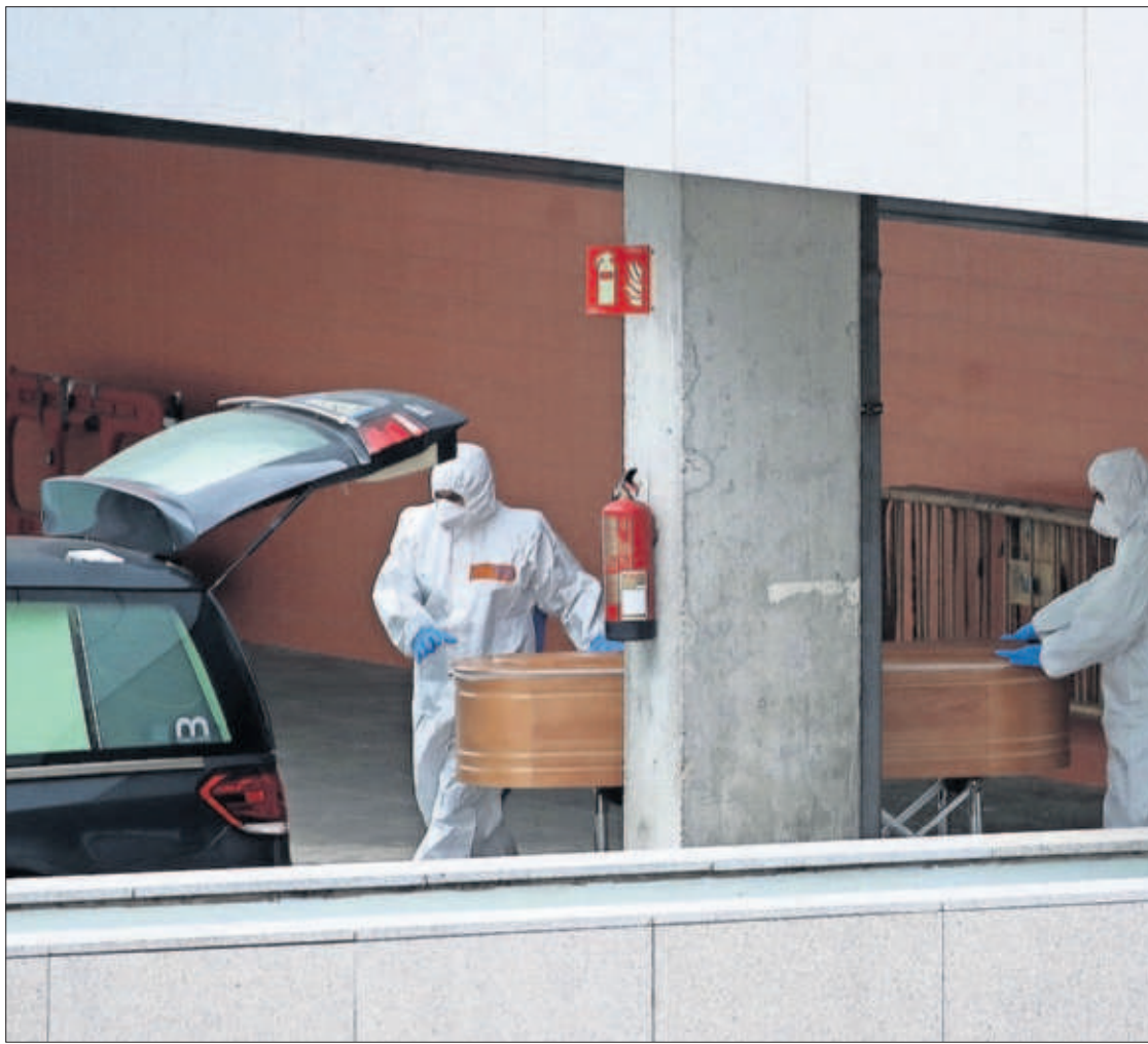
EL VIRUS DE LA TRAGEDIA. El número de personas fallecidas en Madrid por el coronavirus ya ha ascendido a 628. En la imagen, dos empleados de la funeraria, protegidos contra la infección, sacaban un féretro, ayer, del Hospital Universitario Puerta de Hierro.

E. SEVILLANO / I. VALDÉS, Madrid Los hospitales de Madrid —la región más golpeada por el coronavirus— se encuentran a un paso del colapso. Algunos ya atienden en sus Unidades de Cuidados Intensivos (UCI) a más del doble de los pacientes que soporta la capacidad de estas unidades del centro. De hecho, los enfermos críticos se reparten en otras dependencias, como Reanimación o en los quirófanos. Ayer había 678 pacientes ingresados en UCI y similares en Madrid, según datos del Ministerio de Sanidad. Estas unidades son clave para unos enfermos aquejados de neumonías que precisan vigilancia y ayuda para respirar. Un ejemplo: en el hospital Ramón y Cajal, con 14 puestos en la UCI, se contaban el jueves 34 pacientes críticos ingresados. El Ejército prepara ya un hospital de campaña con 5.500 camas y puestos de UCI. La cifra de muertos en España rebasó ayer el millar, tres veces más que Francia y 20 más que Alemania. Sanidad admitió que la presión no se va a aliviar: “Los días duros vienen ahora”. PÁGINAS 18 A 20