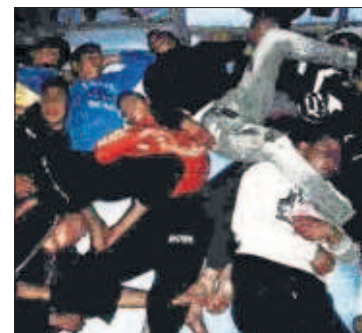
Jóvenes hacinados en el centro La Purísima de Melilla.

queda en situación de aislamiento, como ya estaban Lombardía y otras 14 provincias del Norte. En la imagen, soldados y policías controlan a los viajeros en la estación de tren de Milán. PÁGINAS 28 Y 29