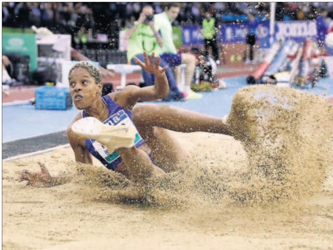
YULIMAR ROJAS 'VUELA' EN MADRID. La venezolana Yulimar Rojas batió ayer el récord mundial de triple salto en pista cubierta en la reunión de Madrid y dejó la nueva marca en 15,43m. Rojas se entrena en Guadalajara a las órdenes del mítico saltador cubano Iván Pedroso. P40