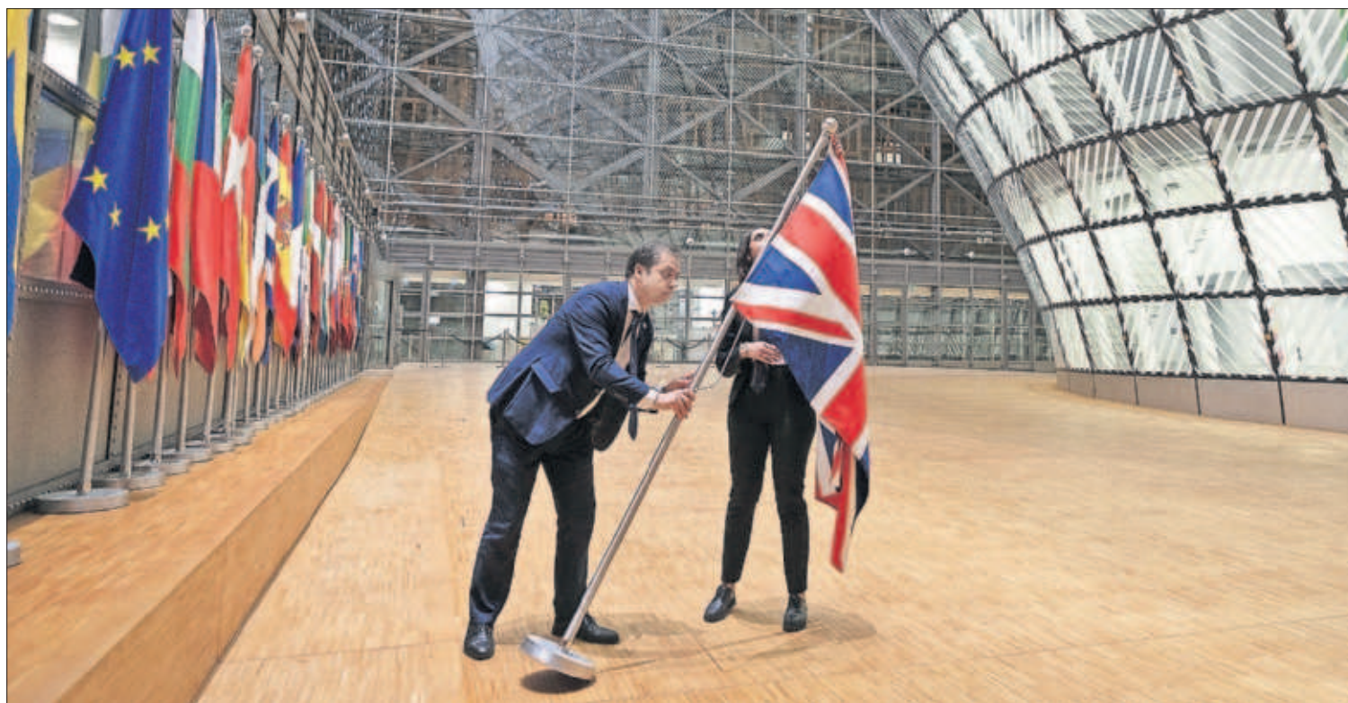
Dos funcionarios retiraban anoche la bandera británica de la sede del Consejo Europeo en Bruselas.

Macron: "El Brexit es una señal de alarma histórica que debe resonar en nuestros países"