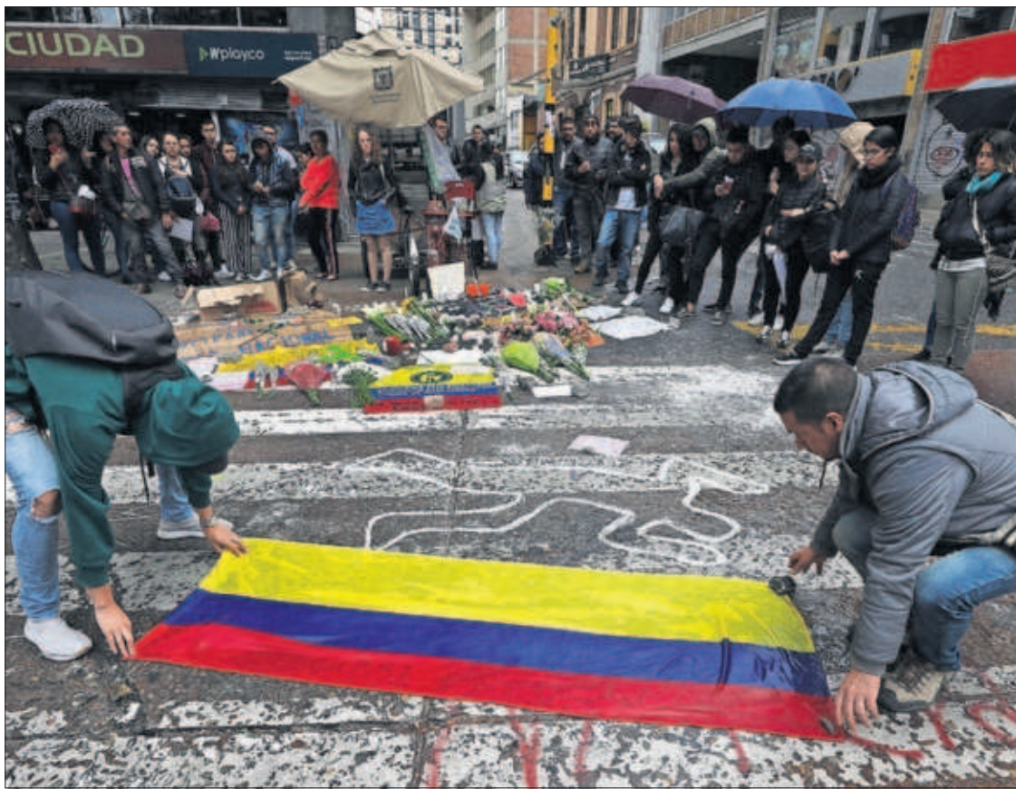
Estudiantes colocan ayer una bandera en el lugar donde Dilan Cruz fue abatido.

EL PAÍS, el medio líder en español en el mundo con más de 85 millones de lectores, refuerza su estructura en América. Para responder a una audiencia cada vez más digital y americana, el diario será 100% digital y dejará de contar con una edición impresa en 2020. EL PAÍS abre el proceso para incorporar a su Redacción de México 12 nuevos puestos. PÁGINA 24