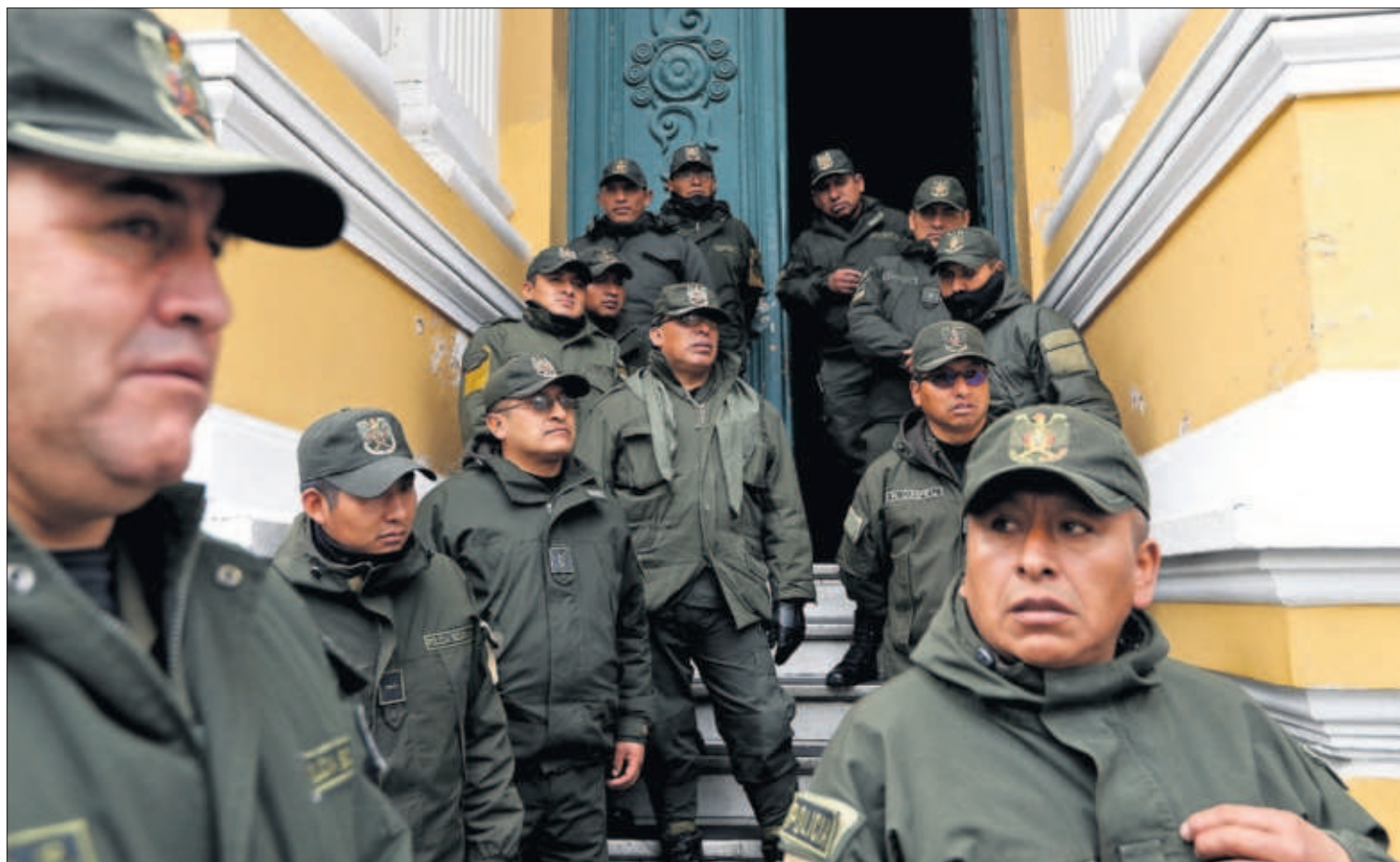
Policías a la entrada del Congreso Boliviano, ayer en La Paz.

L. J. MOÑINO, Madrid La Federación Española de Fútbol confirmó ayer que la Supercopa se jugará, del 8 al 12 de enero, en Arabia Saudí. Ante las críticas por llevar el torneo a un país que no respeta los derechos humanos, la federación esgrimió que el régimen permitirá el acceso libre de mujeres al estadio. Valencia-Real Madrid y Barça-Atlético serán las semifinales. PÁGINAS 34 Y 35