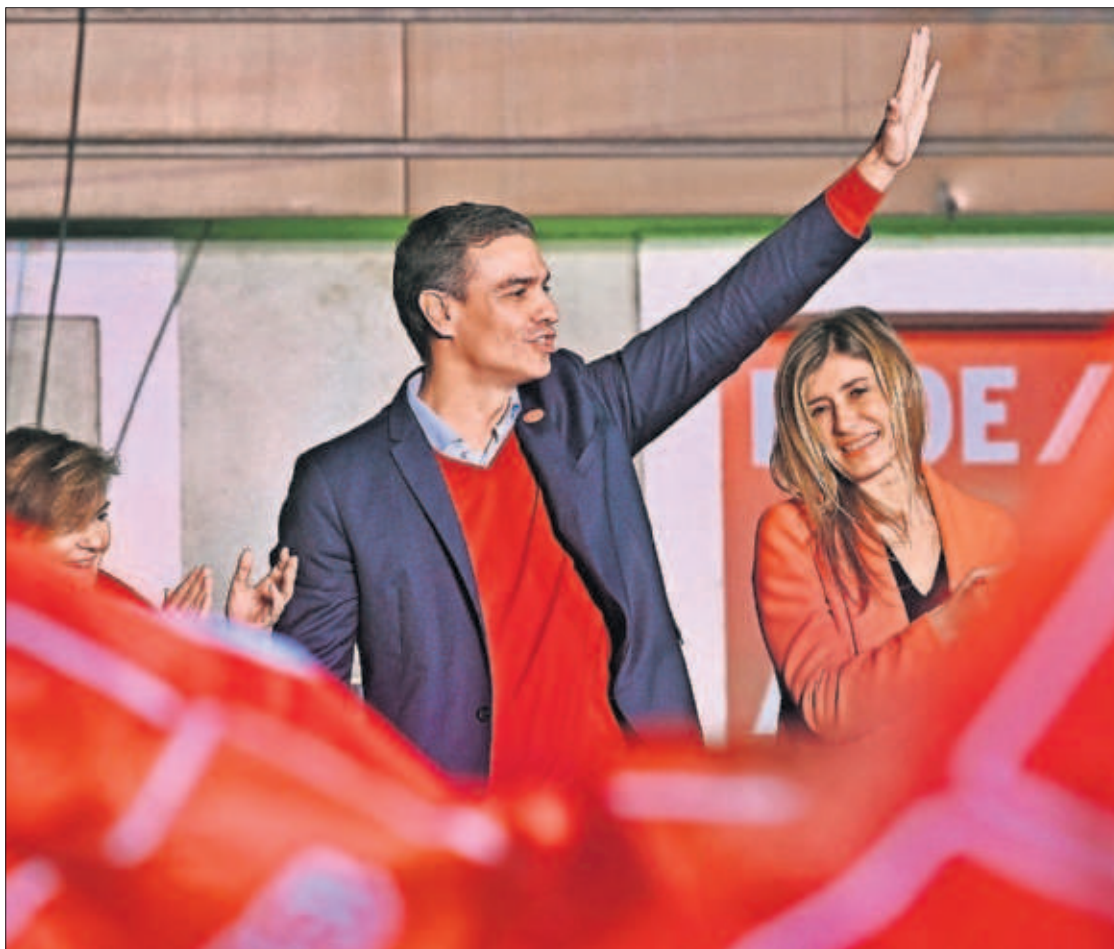
Pedro Sánchez, su esposa Begoña Gómez y Carmen Calvo, a las puertas de Ferraz.

TON CARLOS E. CUÉ, Madrid Las elecciones que debían desbloquear la formación de Gobierno sirvieron para complicarla más aún. El PSOE de Pedro Sánchez fue el más votado, pero la mayoría que lo llevó a La Moncloa en la moción de censura de 2018 se debilita. Avanzan el Partido Popular y en especial la ultraderecha de Vox, mientras Ciudadanos sufre un descalabro. Terminado el recuento, el PSOE pierde tres escaños, y se queda en 120, y su potencial socio Unidas Podemos baja siete hasta los 35. El PP se recupera con vigor y alcanza los 88 escaños y Vox duplica su grupo parlamentario con 52. Ciudadanos se hunde a solo 10 escaños, por detrás de ERC, con 13. El bloque de la derecha más Vox se queda, en todo caso, lejos de la mayoría. El auge de Abascal dificultaría a Casado una abstención en una investidura de Sánchez. PÁGINAS 14 A 42