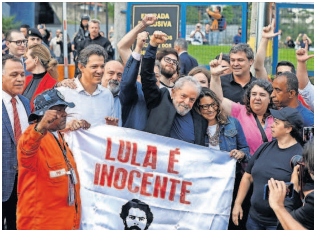
EL EXPRESIDENTE LULA, EN LIBERTAD. Un juez ordenó ayer la puesta en libertad del expresidente brasileño Lula da Silva, en prisión desde hace 19 meses, después de un cambio de jurisprudencia del Tribunal Supremo. En la foto, Lula, a la salida de la cárcel, en Curitiba. PÁGINA 2