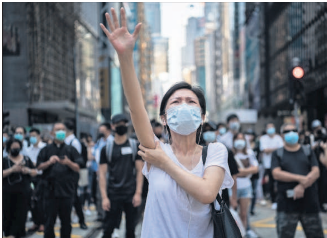
PROHIBIDAS LAS MÁSCARAS EN LAS PROTESTAS DE HONG KONG. El caos se adueñó ayer de Hong Kong después de que el Gobierno autónomo invocara poderes de emergencia para prohibir el uso de máscaras en las manifestaciones. En la imagen, una activista, en una protesta.