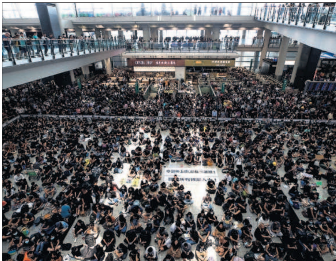
LA PROTESTA EN HONG KONG PARALIZA EL AEROPUERTO Y ENFURECE A CHINA. Miles de manifestantes bloquearon ayer las terminales y obligaron a cancelar todos los vuelos en protesta por la dureza policial. Pekín dijo percibir "signos de terrorismo" en el territorio autónomo. PÁGINA 5

cortes de la que solo se librarán los salarios de los empleados públicos y los servicios básicos. La Comunidad Valenciana ha anunciado ajustes en partidas de gasto aún no comprometidas y sin ejecutar. Y Galicia ha advertido incluso que puede verse comprometido el pago de las nóminas a final de año. PÁGINA 12