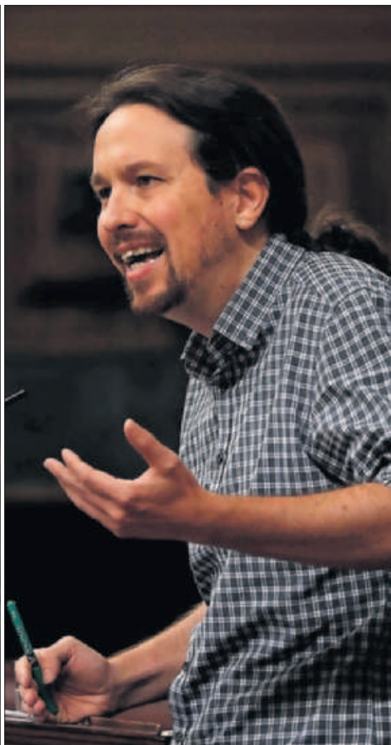
Pedro Sánchez y Pablo Iglesias, ayer durante el debate de investidura en el Congreso.