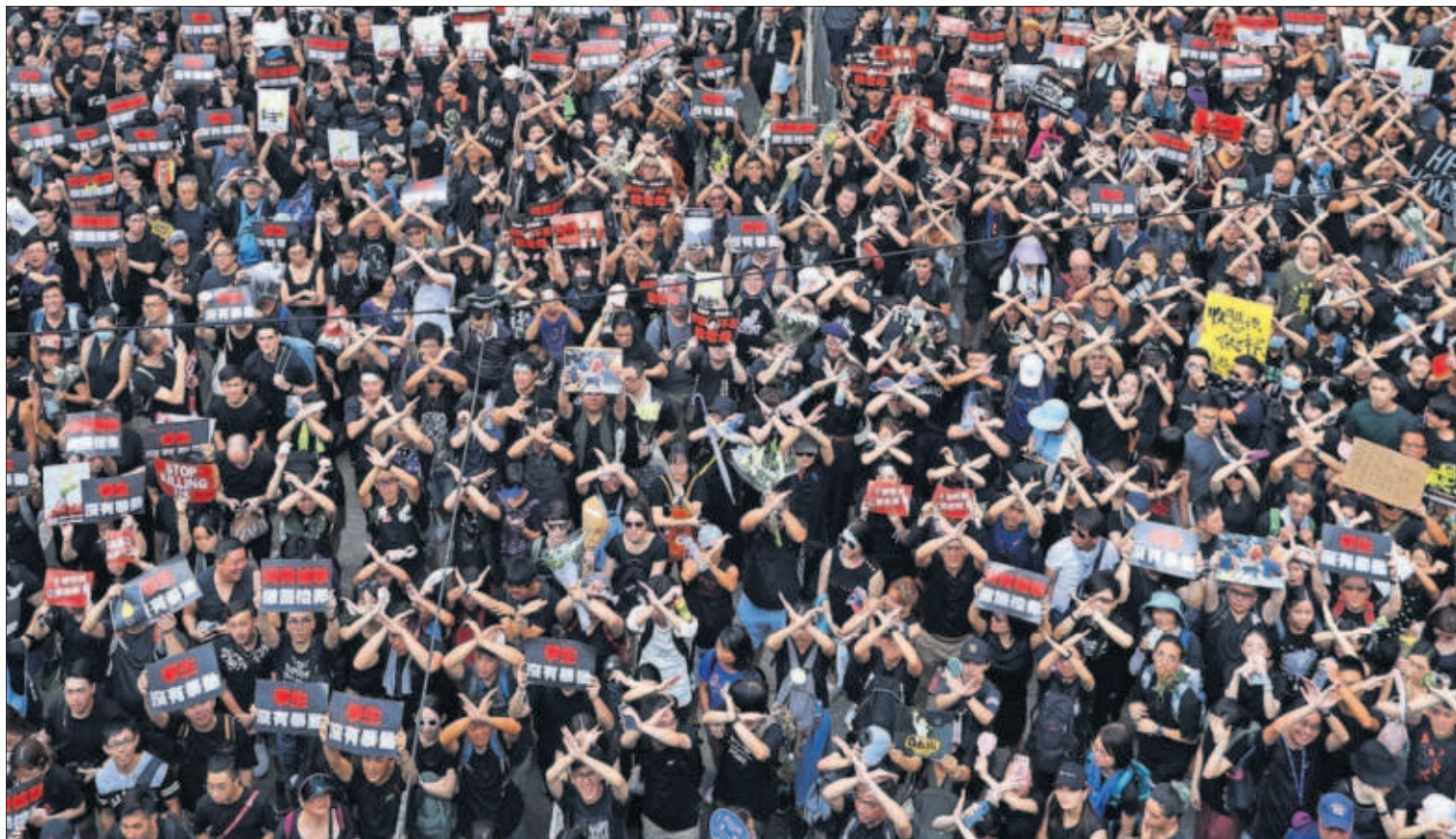
Los manifestantes exhiben con un gesto su rechazo a la ley de amnistía, ayer en Hong Kong.

Las donaciones internacionales son la última esperanza para salvar vidas en Venezuela. Pese a ello, la ayuda de Cruz Roja resulta insuficiente para un país que no está en guerra, aunque sufre carencias similares. Estaba previsto que el plan del organismo humanitario beneficiase a 650.000 personas durante un año, aunque el secretario general adjunto de la ONU, Mark Lowcock, señaló que se necesita asistencia para siete millones de venezolanos. PÁGINA 4