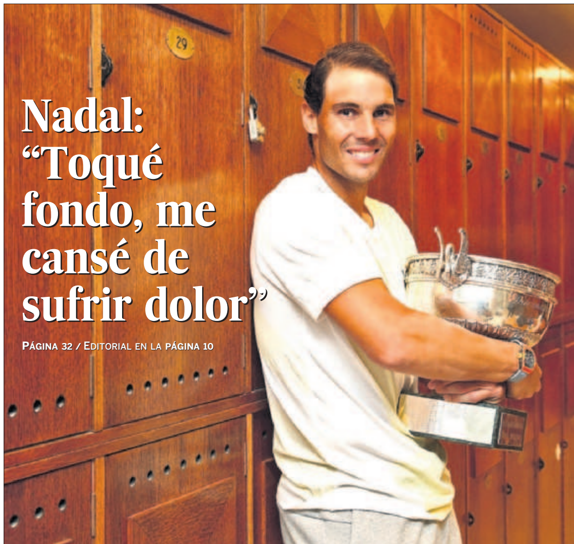
Nadal, en el vestuario tras ganar el domingo el torneo de Roland Garros.

Unas 600 especies han desaparecido en los últimos 250 años, un proceso acelerado por el ser humano desde la Revolución Industrial