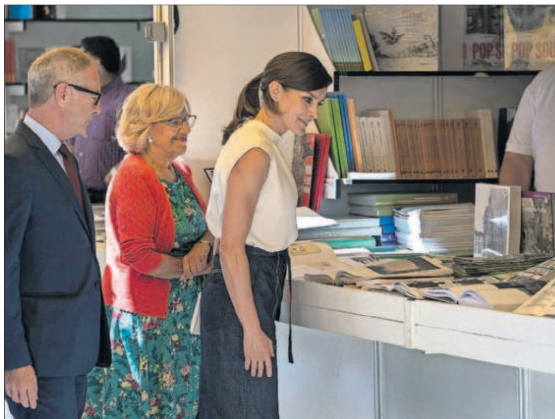
ARRANCA LA FERIA DEL LIBRO. La reina Letizia recorrió ayer el evento editorial en el Retiro de Madrid junto al ministro José Guirao y a la alcaldesa, Manuela Carmena, ambos en funciones. Doña Letizia se interesó por novelas, ensayos sobre feminismo e historia y literatura juvenil. PÁGINA 27