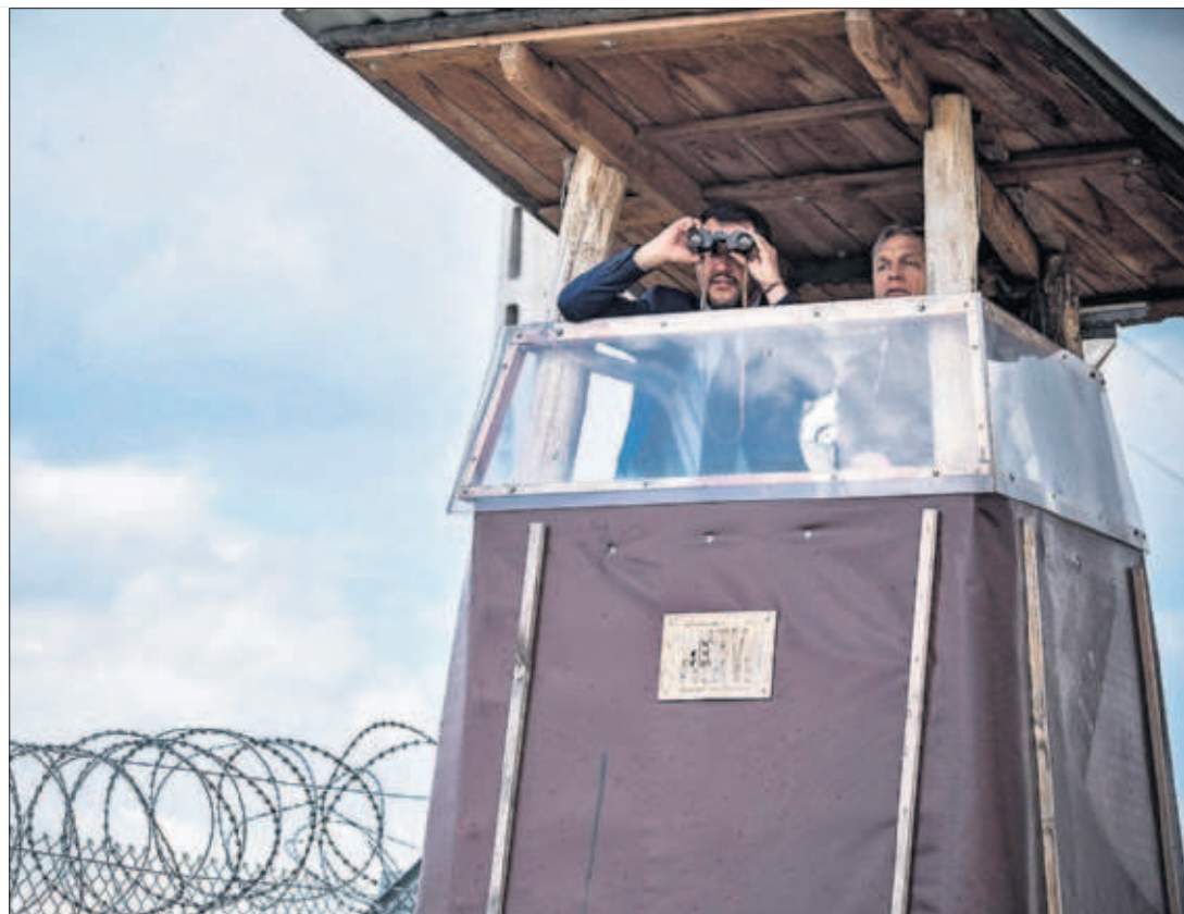
Matteo Salvini, con prismáticos, y Viktor Orbán, ayer en la frontera serbohúngara.

El partido de Santiago Abascal considera una “ofensa” y una “injuria” que el PP los considere de extrema derecha, palabras que el partido en Andalucía ha evitado repetir. La cercanía de las elecciones del 26 de mayo complica la situación. PÁGINA 15