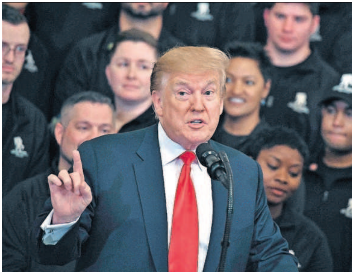
Donald Trump, el jueves en un acto en el Ala Oeste de la Casa Blanca.