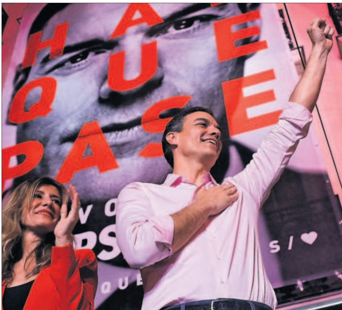
Sánchez saluda junto a su mujer, Begoña Gómez, a los seguidores del PSOE en la sede de Ferraz. / B. ARMANGUE (AP)

28A CARLOS E. CUÉ, Madrid El PSOE de Pedro Sánchez ganó ayer con 123 escaños unas elecciones generales después de 11 años, pero se quedó lejos de la mayoría absoluta en el Congreso, situada en los 176. La suma de los diputados socialistas más los de Unidos Podemos, que retrocede hasta los 42, llega a 165, a 11 de esa mayoría. Tampoco el PP, Ciudadanos y Vox podrán gobernar juntos. El PP registra el peor resultado de su historia y se desploma desde los 137 hasta los 66 diputados, Ciudadanos crece hasta 57 y Vox irrumpe en el Parlamento con 24. Con Navarra Suma, el bloque de la derecha se queda en 149 actas. El PSOE lograría la mayoría absoluta con Ciudadanos, y se quedaría al borde de conseguirla si pactase con Unidos Podemos y las fuerzas autonómicas no independentistas. Al celebrar su victoria, Sánchez proclamó: "Hemos mandado un mensaje al mundo de cómo derrotar a la involución y a la derecha". PÁGINAS 18 A 48