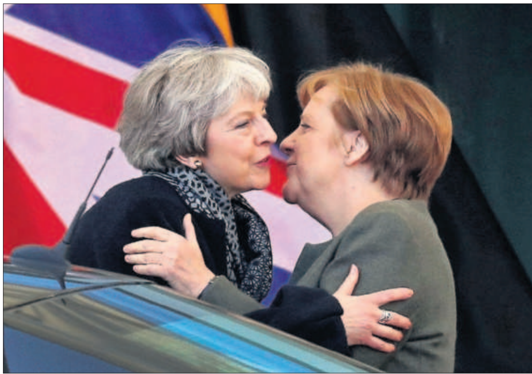
EUROPA ASUME OTRA PRÓRROGA DEL BREXIT. Theresa May se reunió ayer con Angela Merkel, en la imagen, y con Emmanuel Macron en busca de apoyos para una nueva prórroga del Brexit. La UE ve inevitable el retraso, pero los 27 decidirán hoy sus condiciones.