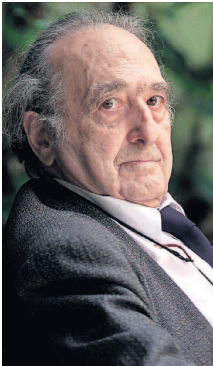
El escritor Rafael Sánchez Ferlosio, en Barcelona en 2003.

MANUEL V. GÓMEZ, Madrid El mercado de automóviles encadena su peor racha desde la Gran Recesión. En marzo sumó su séptimo mes seguido de caídas. Se vendieron 122.664 coches, un 4,3% menos que en el mismo periodo del año anterior. Las razones, además de económicas, hay que buscarlas en las restricciones medioambientales. PÁGINA 38