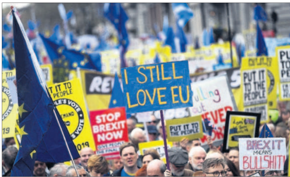
UNA MULTITUD SALE A LA CALLE EN LONDRES CONTRA EL BREXIT. Centenares de miles de personas llegadas de todo el Reino Unido se manifestaron ayer en la capital para protestar por el Brexit, la gestión del Gobierno de Theresa May y pedir un segundo referéndum. PÁGINAS 4 A 6

Pablo Iglesias, secretario general de Podemos, volvió ayer a la política tras tres meses de baja de paternidad y en medio de la grave crisis abierta en el partido con la marcha de Íñigo Errejón. Lo hizo en Madrid, en un mitin al aire libre, donde reivindicó los orígenes de su formación. No mencionó “la casta” de sus primeras apariciones públicas, pero sí a “los poderosos”. También ejerció la autocritica: “Hemos dado vergüenza ajena con nuestras peleas internas”, aunque matizó: “Pero nunca nos hemos cambiado de lado”. PÁGINA 22