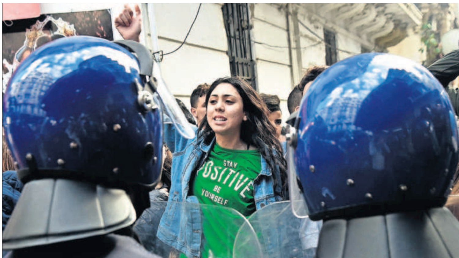
MILES DE JÓVENES DESAFÍAN AL RÉGIMEN ARGELINO. Miles de estudiantes se manifestaron ayer en Argel y otras ciudades del país contra la candidatura del presidente Buteflika a un quinto mandato, un desafío inédito en sus 20 años en el poder. PÁGINA 6

Borrell liderará la lista europea del PSOE P15