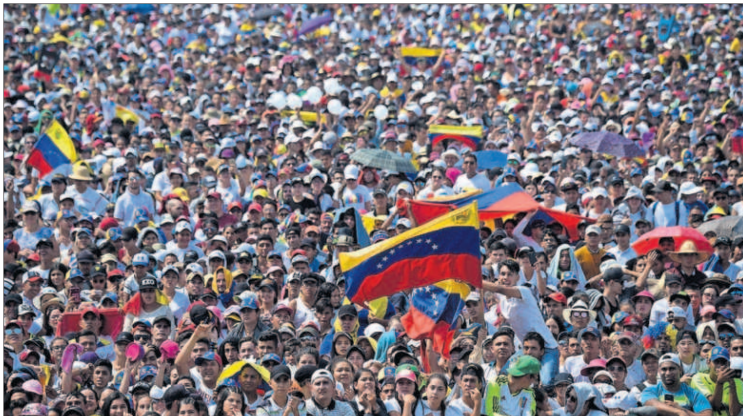
Miles de personas esperan el inicio del concierto Venezuela Aid Live en el lado colombiano de la frontera.

Los seguidores de Guaidó intentan introducir hoy en Venezuela la ayuda humanitaria