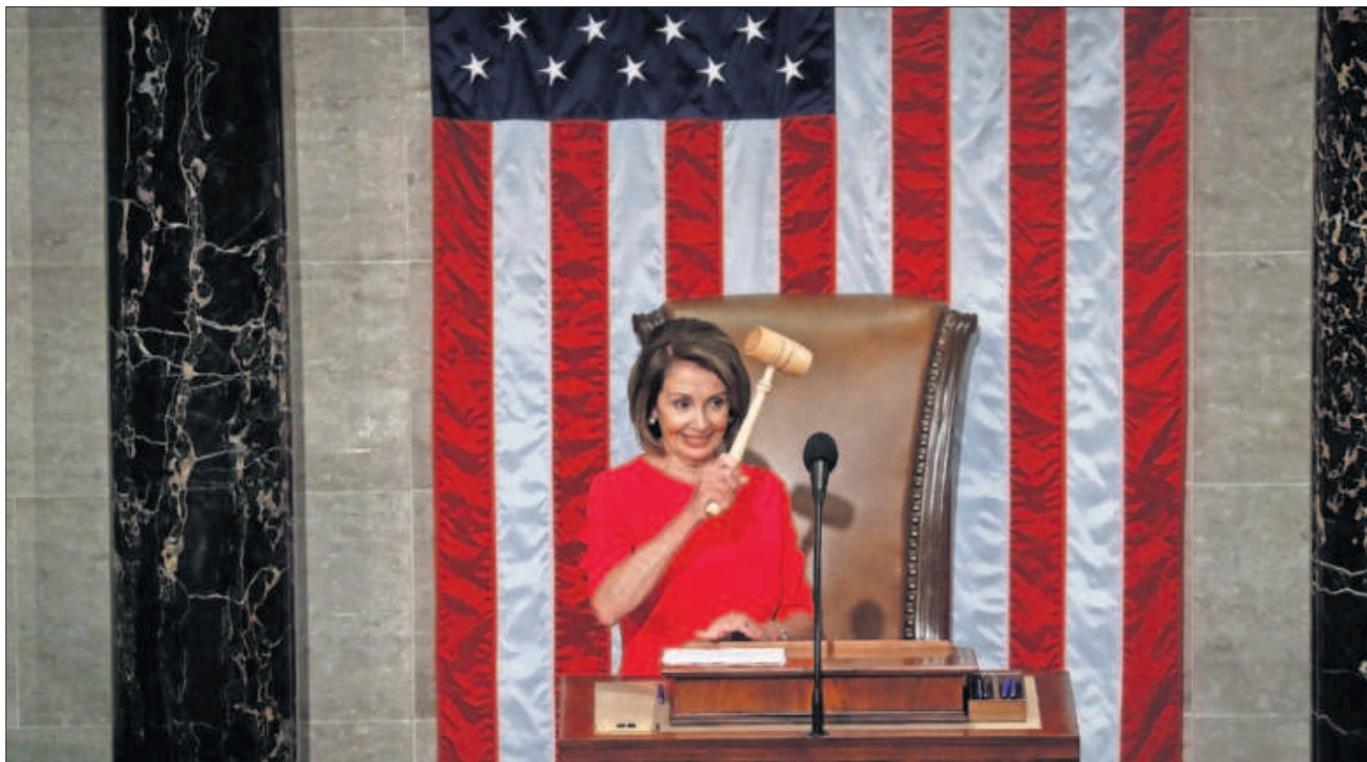
Nancy Pelosi sostiene el mazo de la Presidencia de la Cámara de Representantes tras ser elegida ayer en el Capitolio.