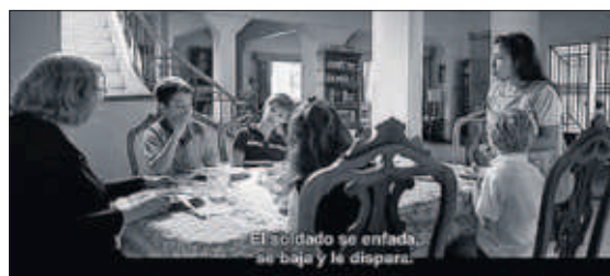
Rótulo que traduce al español de la península “se enoja el soldado, se baja el soldado y le disparó”.

¿Es preciso subtítular en España una película mexicana? Roma, de Alfonso Cuarón, enciende el debate sobre la lengua común porque se proyecta para los espectadores españoles con subtítulos innecesarios