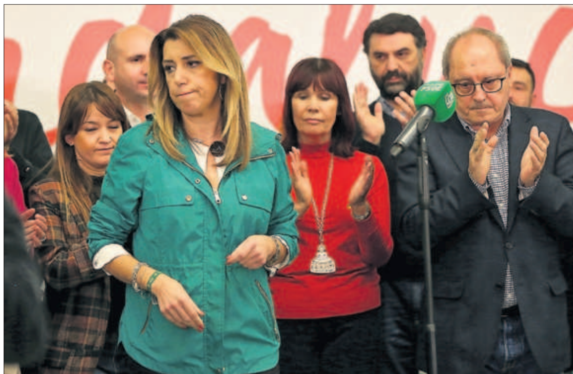
Susana Díaz, ayer en un hotel de Sevilla tras comparecer ante los medios de comunicación.