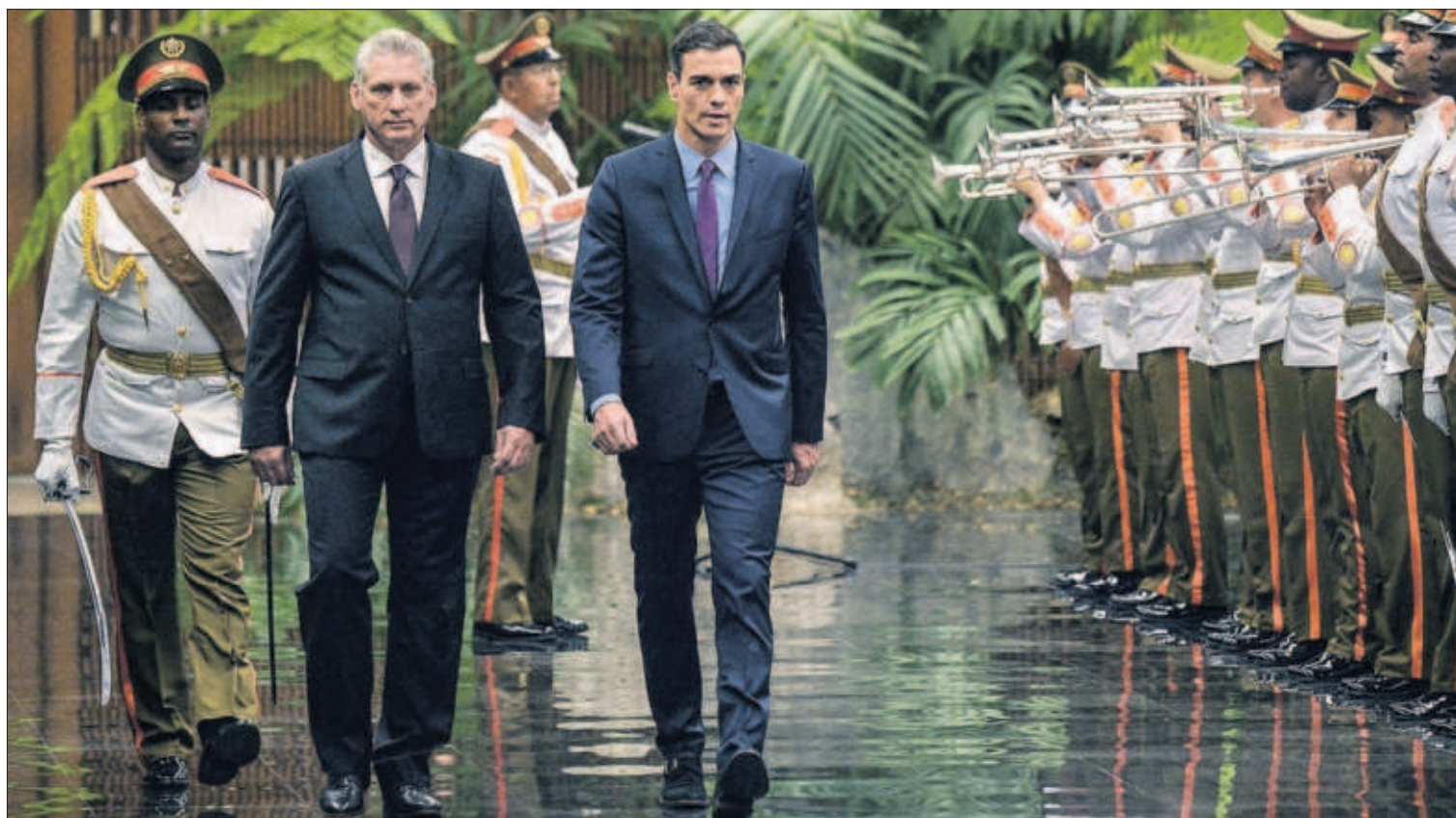
APOYO ESPAÑOL AL APERTURISMO CUBANO. Pedro Sánchez expresó ayer en La Habana su respaldo al “impulso reformista” del nuevo presidente cubano, Miguel Díaz-Canel. En la imagen, los dos mandatarios en un acto en el Palacio de la Revolución. PÁGINA 19

Cinco autores, cinco puntos en el mapa de las Américas