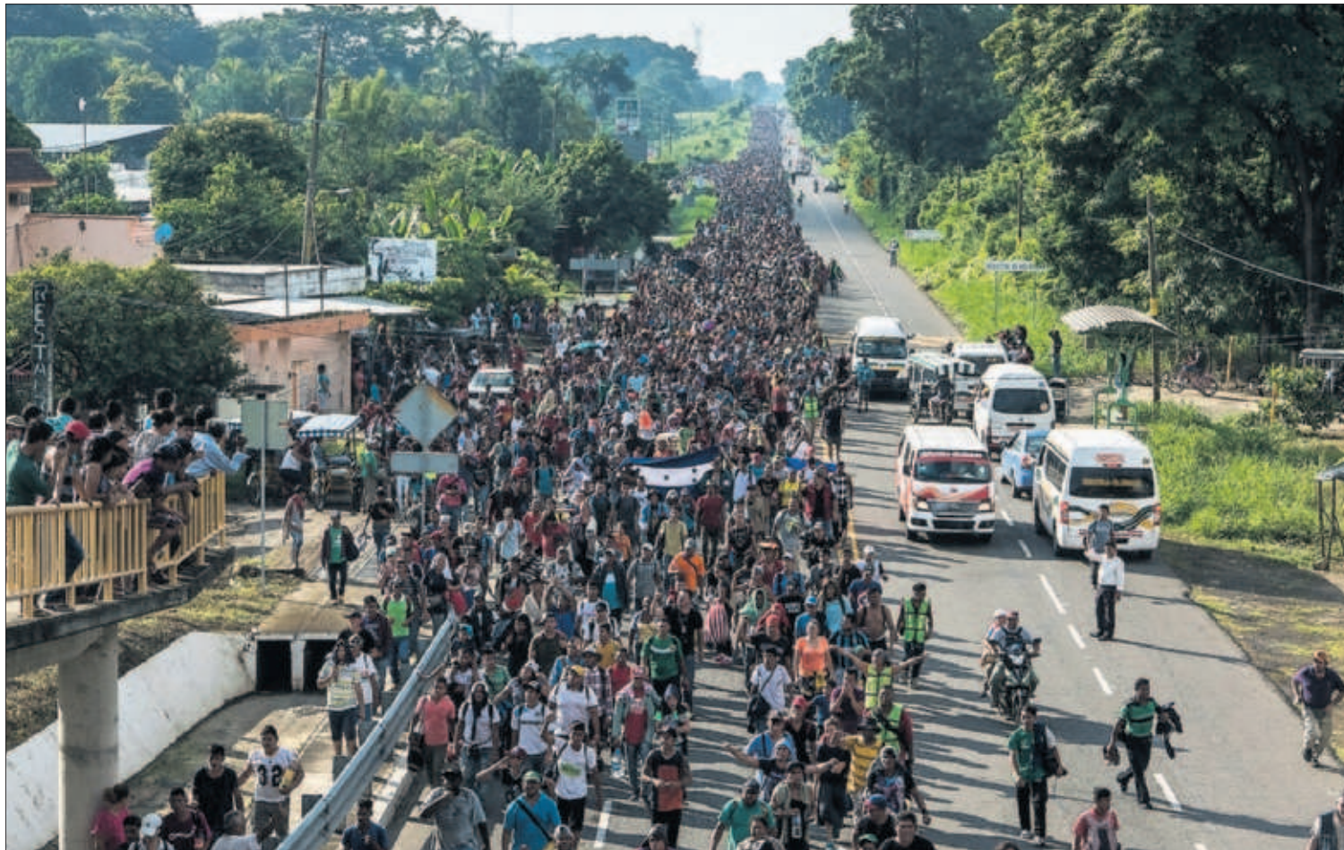
La caravana de inmigrantes centroamericanos avanza por la carretera que conduce a Tapachula, en Chiapas.

interés en responder. Por otra parte, López Obrador nombró ayer a los nuevos responsables de las Fuerzas Armadas: el secretario de Marina, el almirante José Rafael Ojeda, y el ministro de Defensa, el general Luis C. Sandoval. PÁGINAS 6 Y 7