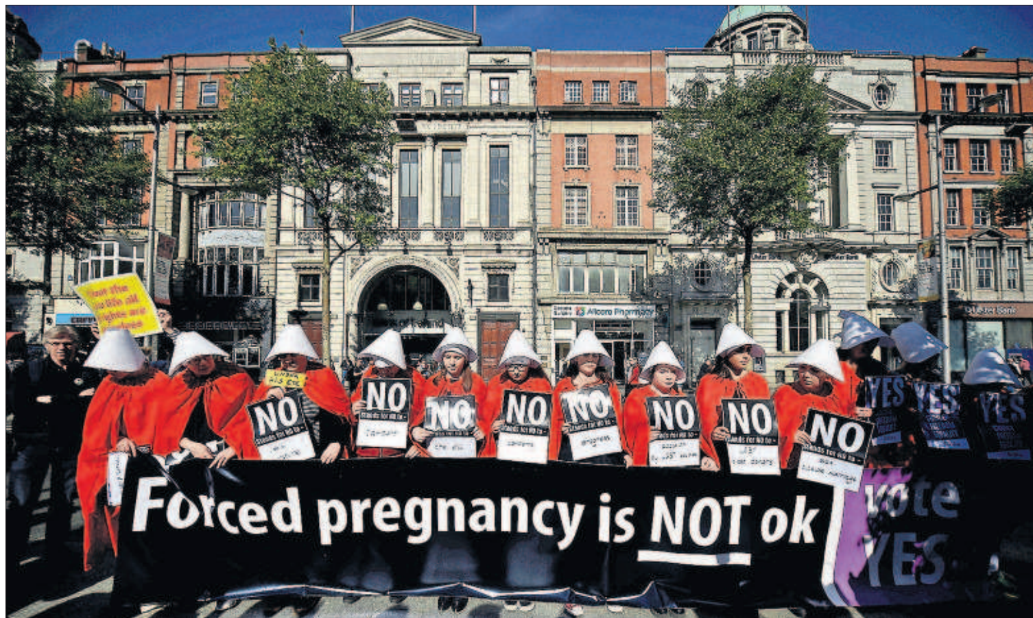
IRLANDA AFRONTA SU ÚLTIMO TABÚ. Irlanda decide mañana en referéndum si retira una enmienda a la Constitución que otorga al feto los mismos derechos que a la madre, lo que ilegaliza el aborto. En la imagen, activistas proaborto, ayer en Dublín. PÁGINA 5

Cuatro militares irán a prisión entre 33 y 58 años por crímenes de lesa humanidad