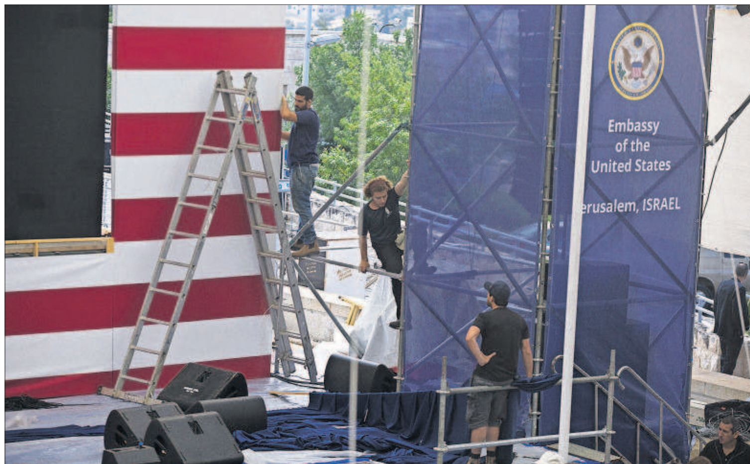
JERUSALÉN SE PREPARA PARA ACOGER LA EMBAJADA DE ESTADOS UNIDOS. EE UU materializa hoy su polémica decisión de trasladar su Embajada en Israel de Tel Aviv a Jerusalén. En la foto, varios trabajadores preparan un estrado para la ceremonia. PÁGINA 5

PÁGINAS 16 Y 17 EDITORIAL EN LA PÁGINA 12