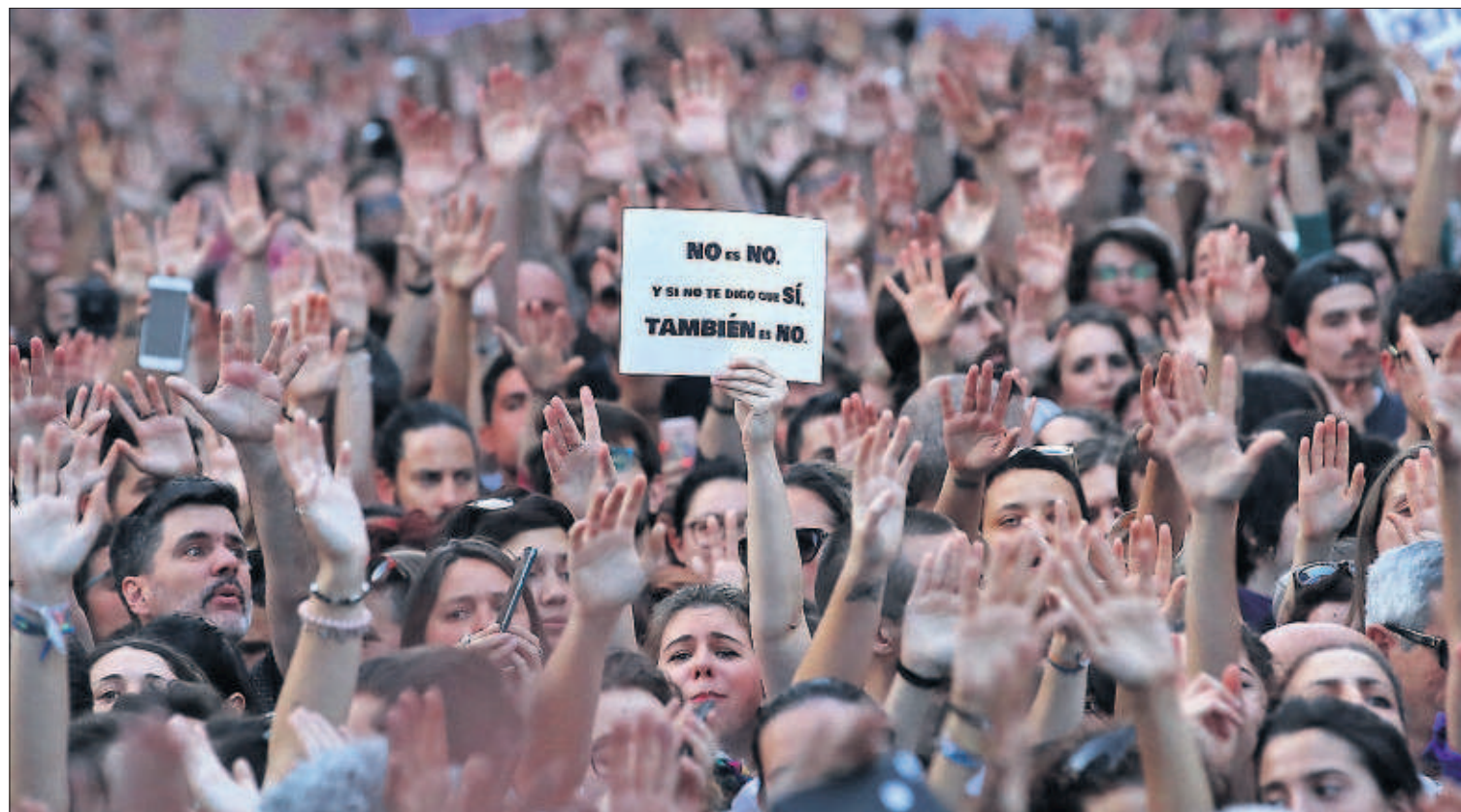
Concentración contra la sentencia del juicio de La Manada, ayer, frente a la sede del Ministerio de Justicia en Madrid.