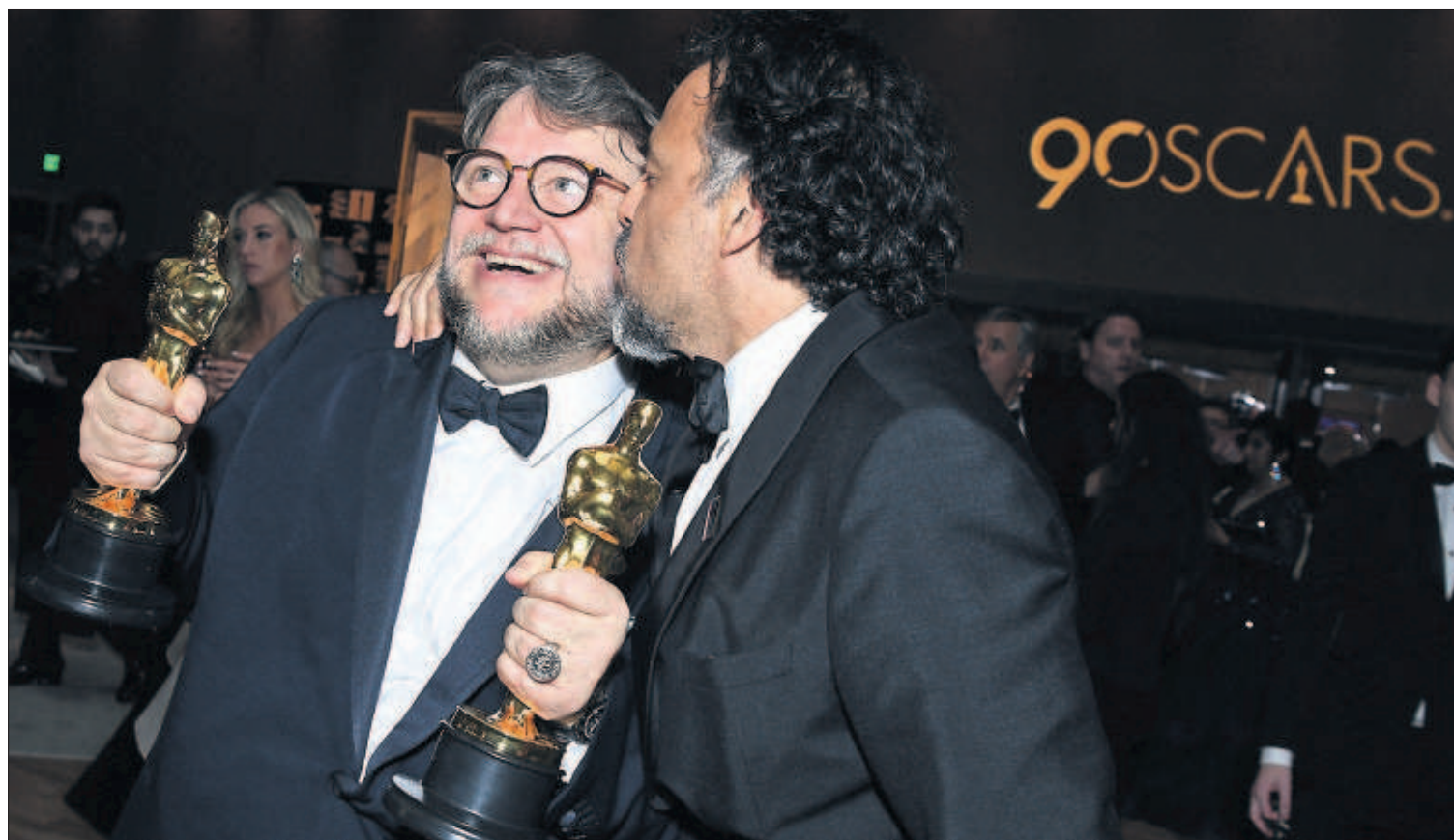
Guillermo del Toro recibe la felicitación de Alejandro González Iñárritu tras la ceremonia de los Oscar en Los Ángeles.

El PSG se conjura para remontar al Madrid P31 A 34