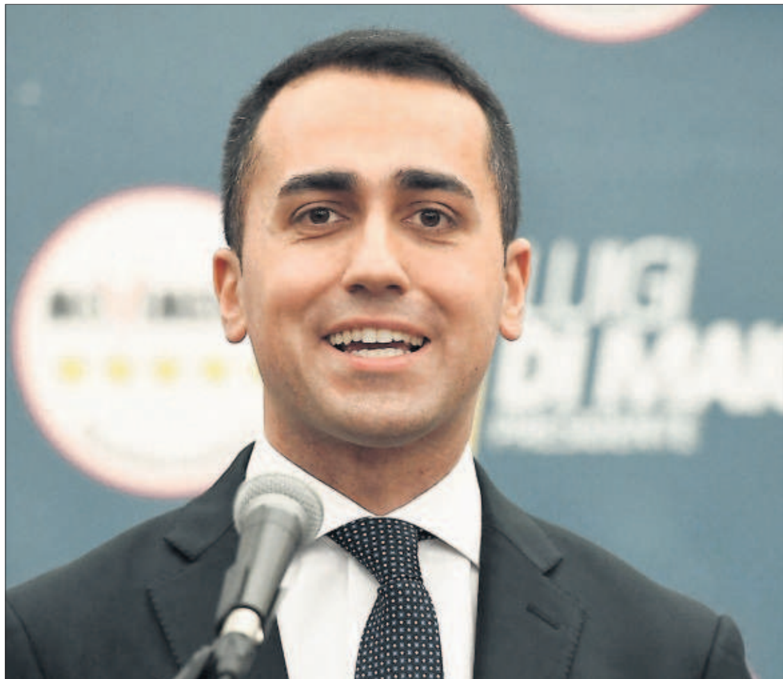
Luigi di Maio, candidato del Movimiento 5 Estrellas, celebra su victoria ayer en Roma.

En cuanto a la jornada de huelga del 8 de marzo, cuenta con un muy amplio respaldo entre los españoles: el 82% de los encuestados cree que hay motivos suficientes para convocar la protesta contra la discriminación que sufren las mujeres. El 80% considera que en España predominan los comportamientos machistas, aunque el 65% dice que la situación ha mejorado en los últimos 20 años. PÁGINAS 16 Y 17