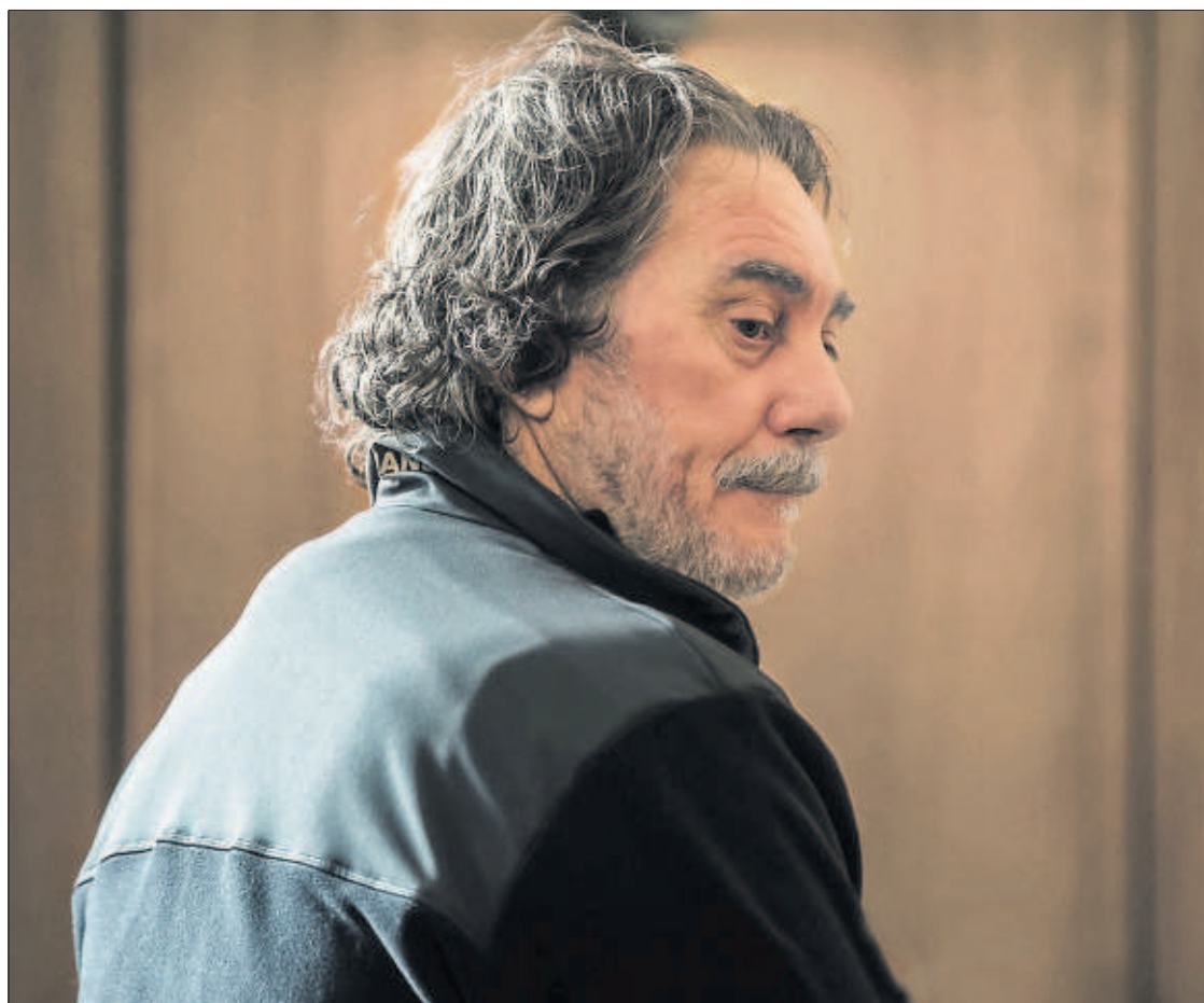
EL CAPO VUELVE AL BANQUILLO. El narco Sito Miñanco, excarcelado en 2015 tras cumplir condena por tráfico de cocaína, volvió ayer al banquillo en Pontevedra acusado de blanqueo de capitales. / Ó. CORRAL PÁGINA 23

Más líneas de móvil que habitantes en el mundo P40