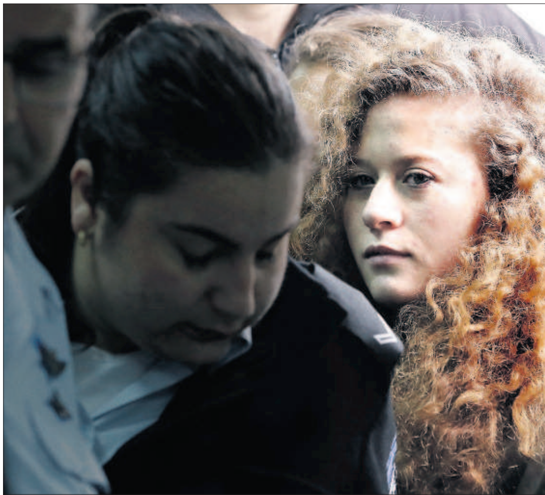
UN SÍMBOLO DE 17 AÑOS. La palestina Ahed Tamimi (a la derecha) esperaba ayer para ser juzgada ante un tribunal militar israelí en una prisión de Beitunia. La joven activista se enfrenta a una condena que podría llegar hasta los 10 años de cárcel por abofetear a dos soldados. / T. COEX (AP). PÁGINA 10

das que cambiaban de manos en plena fiebre del ladrillo, pero la gran crisis del sector está dejando atrás a toda velocidad la marca de 2013, cuando el mercado tocó suelo con 312.593 casas. El 2017 ha sido el cuarto año consecutivo de recuperación, con la mayor tasa de crecimiento registrada desde antes de la crisis. PÁGINA 37