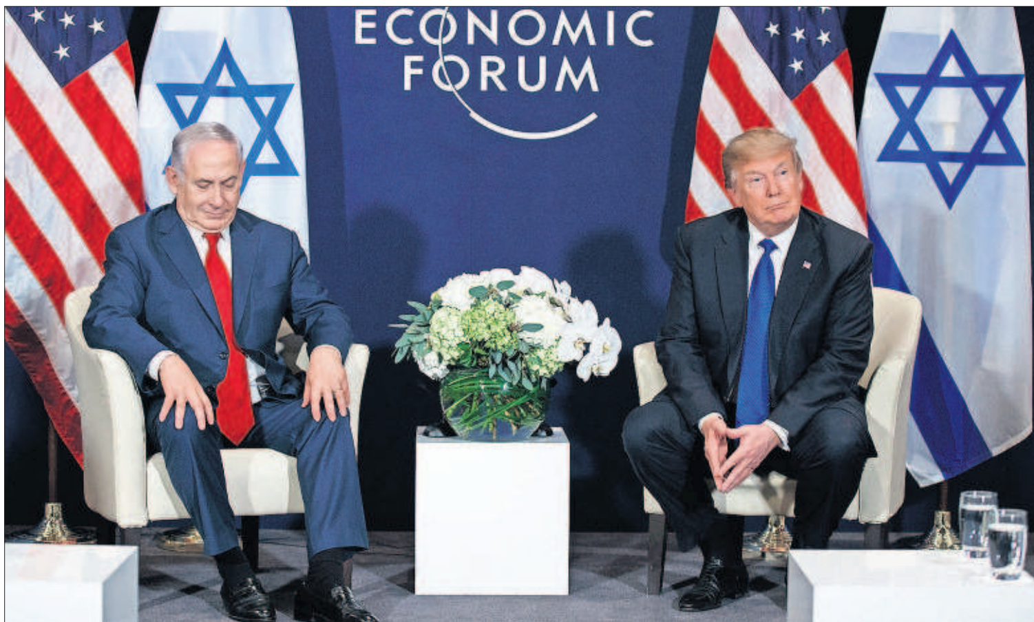
TRUMP DEFIENDE EN DAVOS SU 'AMÉRICA PRIMERO'. El presidente de EE UU, Donald Trump, defendió ayer su política aislacionista en el Foro Económico de Davos. Además, a su llegada aseguró que declarará bajo juramento ante el fiscal que investiga la supuesta connivencia entre su equipo y Moscú para interferir en las elecciones de 2016. En la imagen, Trump, ayer, con el primer ministro israelí, Benjamín Netanyahu. PÁGINAS 3 Y 4