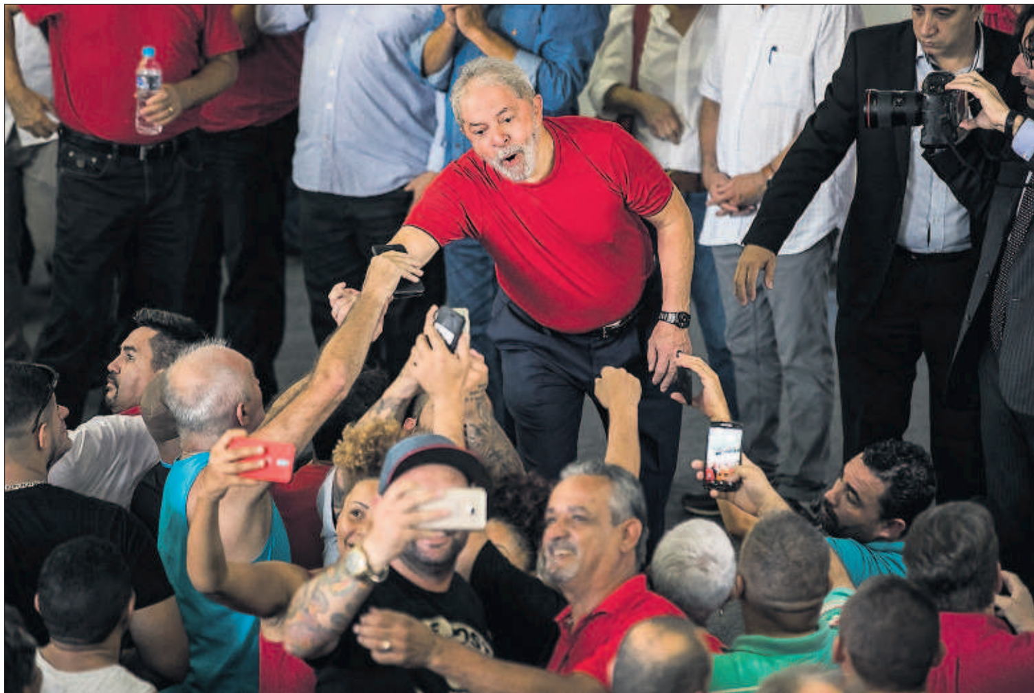
El expresidente brasileño Luiz Inácio Lula da Silva, ayer en un acto en un sindicato metalúrgico en São Paulo.