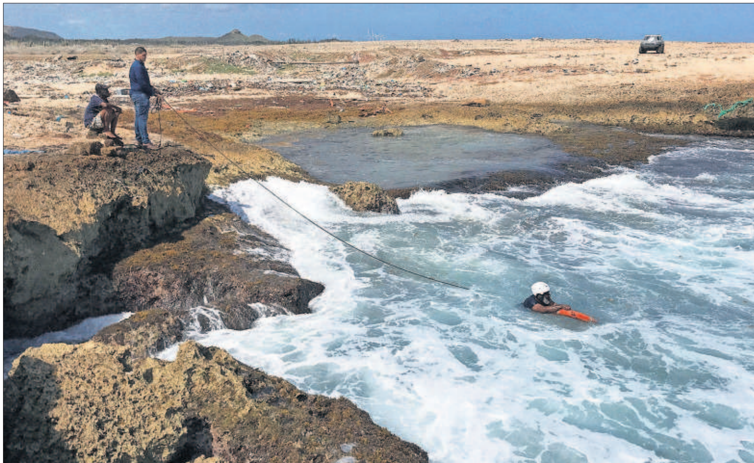
UMPI WELVAART (REUTERS)