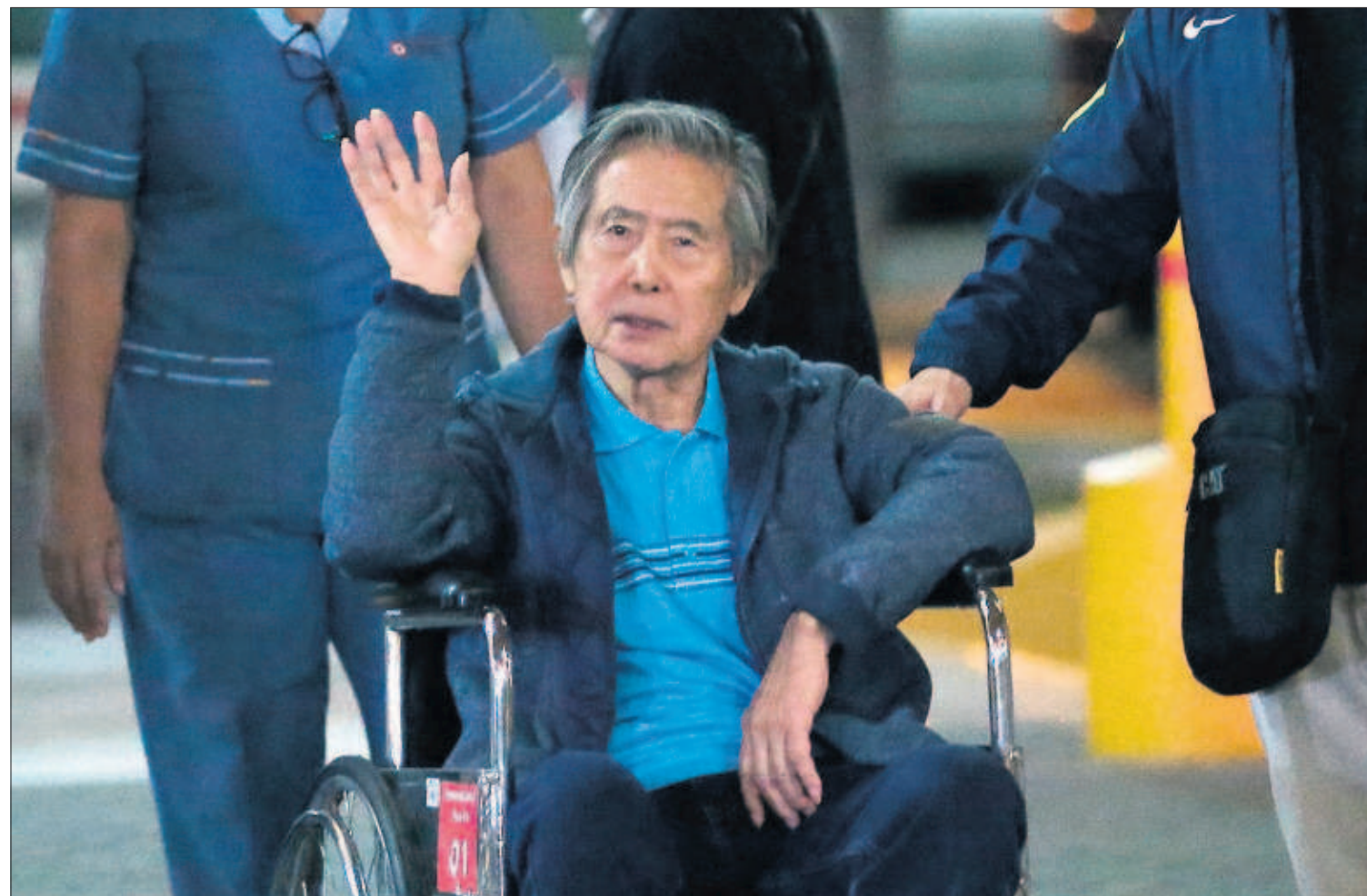
FUJIMORI VUELVE A CASA 11 DÍAS DESPUÉS DE SU INDULTO. La salida del exmandatario peruano de la clínica, tras ser excarcelado en Nochebuena por motivos humanitarios, aumenta la ola de rechazo contra la decisión del presidente Kuczynski. P5

El presidente se refugia en el 'establishment' republicano tras romper con Bannon