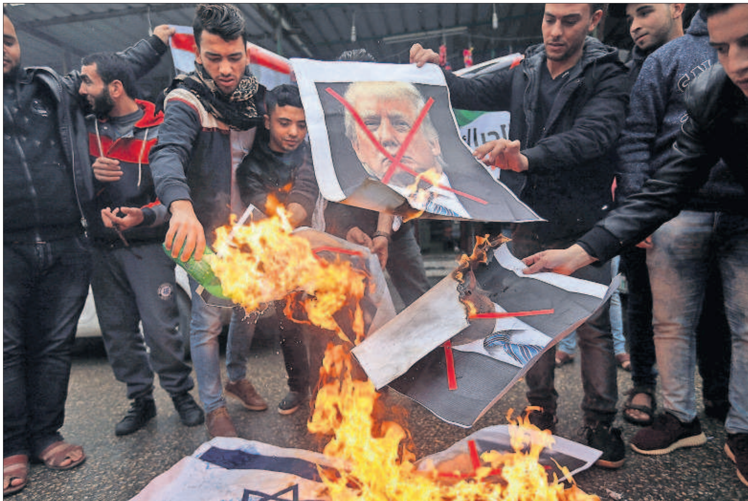
Un grupo de palestinos quema imágenes de Donald Trump y Benjamín Netanyahu durante una protesta ayer en el sur de Gaza.

SUNDAR PICHAI Consejero delegado de Google