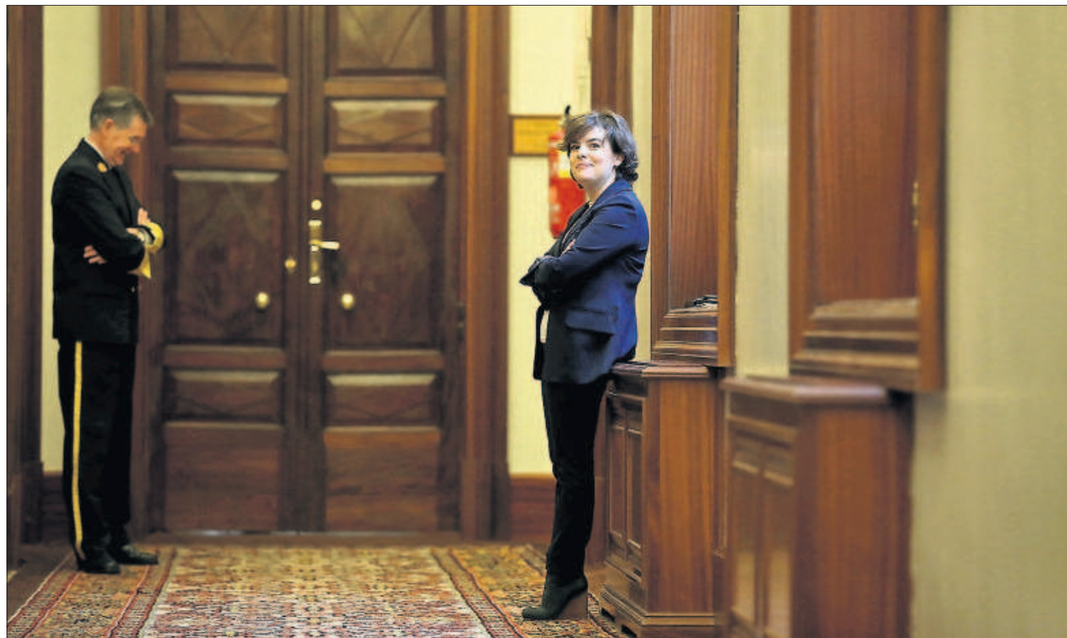
A LA ESPERA DE LA LLAMADA EN LA COMISIÓN DE SECRETOS OFICIALES. La vicepresidenta del Gobierno, Soraya Sáenz de Santamaría, ayer, esperando para intervenir en la comisión de Secretos Oficiales del Congreso.