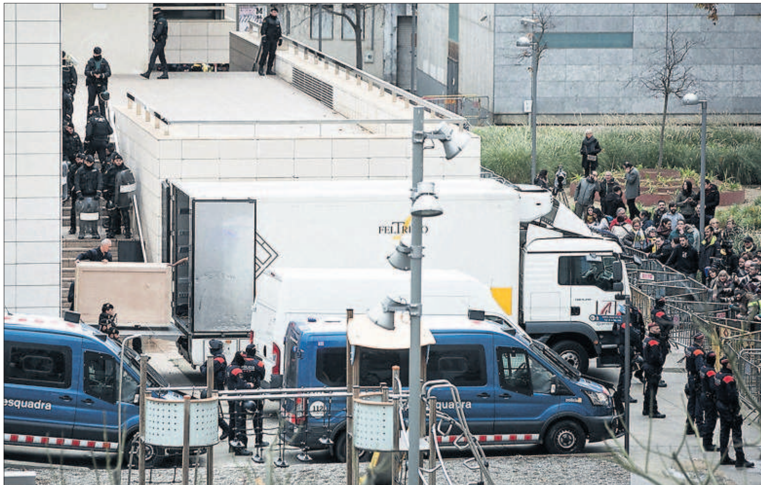
EL TESORO REGRESA A SIJENA. Los bienes reclamados por Aragón son introducidos en el camión que los transportó del Museo de Lleida a Huesca. A la derecha, los Mossos vigilan a los manifestantes opuestos al traslado. PÁGINAS 18 Y 19 / EDITORIAL EN LA PÁGINA 12