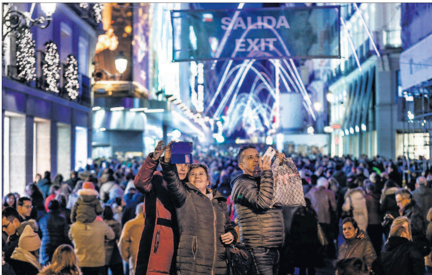
SENTIDO ÚNICO PARA PEATONES EN MADRID. Los visitantes que abarrotan Madrid en el puente más concurrido del año se han encontrado con la novedad del sentido único para peatones en calles como Preciados (en la foto). / CLAUDIO ÁLVAREZ PÁGINA 23