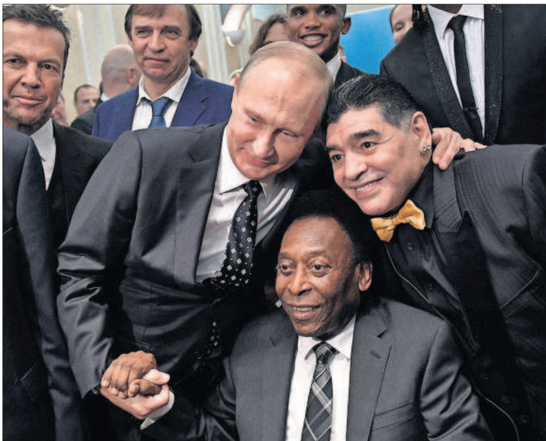
EL MUNDIAL DE PUTIN. El Mundial de 2018 arrancó ayer con el sorteo de los grupos. En la foto, Vladímir Putin con Pelé, Maradona, Matthäus (izquierda), y Eto'o (detrás de Putin). PÁGINA 31