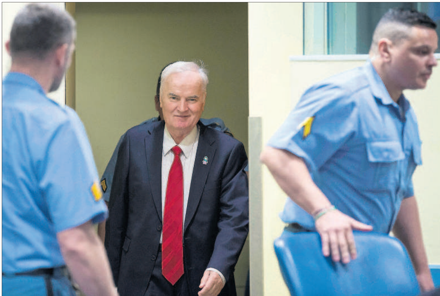
CADENA PERPETUA PARA EL ÚLTIMO CARNICERO DE LOS BALKANES. El general serbobosnio Ratko Mladic (centro de la foto), culpable de la matanza de 8.000 musulmanes en Srebrenica en 1995, fue condenado ayer a cadena perpetua en La Haya. PÁGINAS 3 Y 4