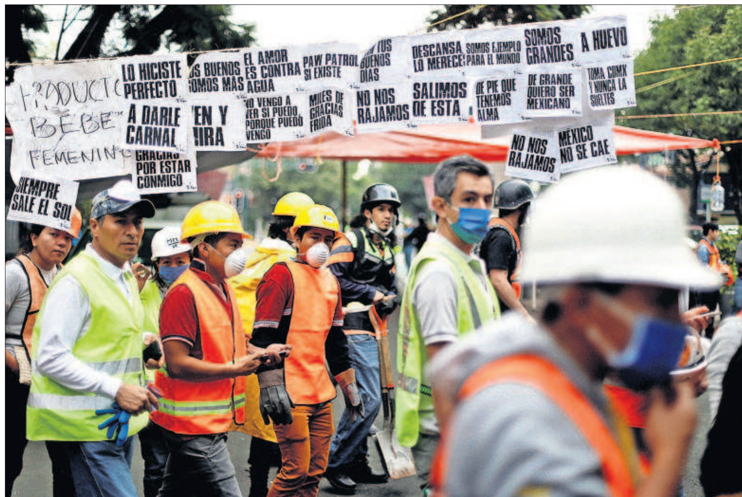
Trabajadores y voluntarios de rescate pasan ayer en la capital mexicana junto a pancartas de ánimo.

Miles de personas siguen trabajando en inmuebles dañados por el sismo