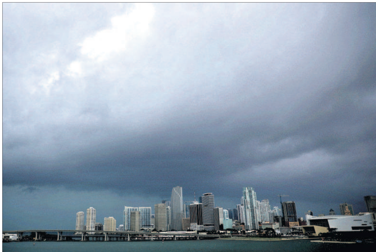
Vista de los rascacielos de Miami, ayer, poco antes de la llegada del huracán Irma a Florida.

En las entrañas del gigante de la red Amazon