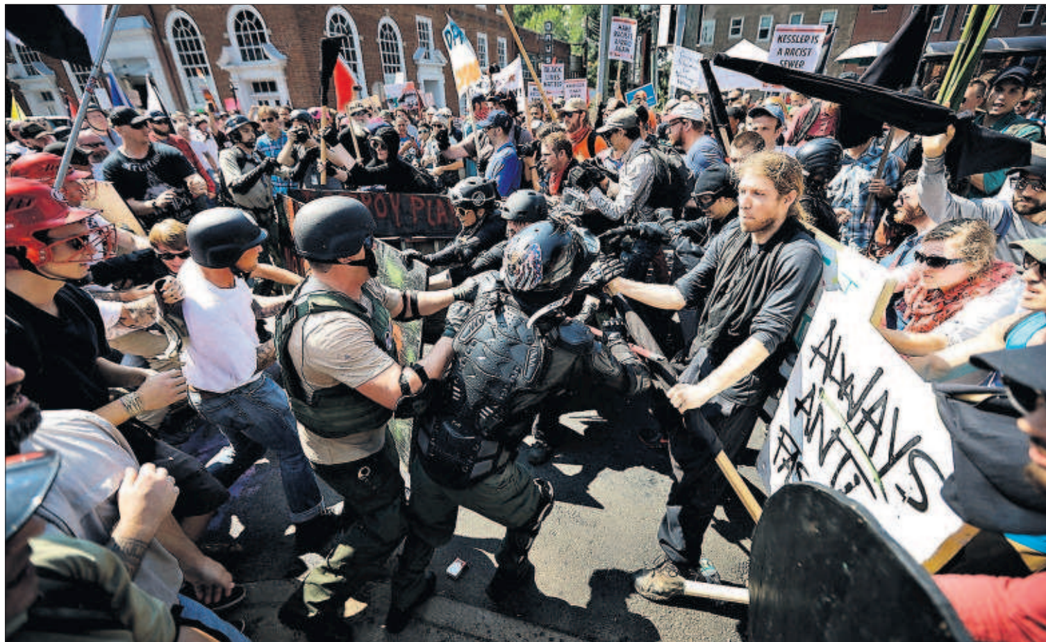
CHIP SOMODEVILLA (AFP)