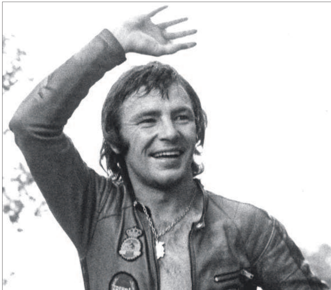
MUERE ÁNGEL NIETO, LEYENDA DEL MOTOCICLISMO. Trece veces campeón del mundo, el zamorano Ángel Nieto falleció ayer en Ibiza tras sufrir un empeoramiento repentino. Nieto, de 70 años, llevaba ocho días en coma víctima de un accidente de tráfico. En la foto, celebrando una victoria en 1972. PÁGINAS 27 A 29